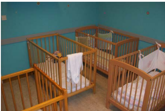
L'une de nos quatre chambres