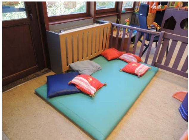
Un espace doux toujours présent