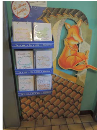
Les albums familles