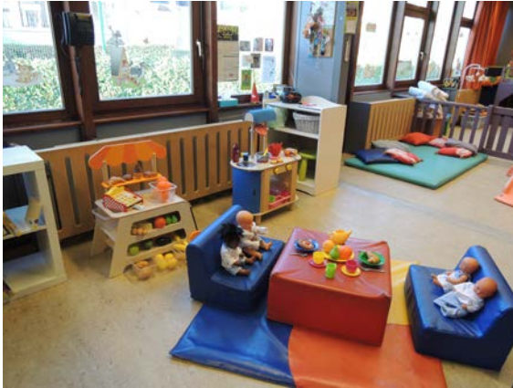
Des jeux diversifiés