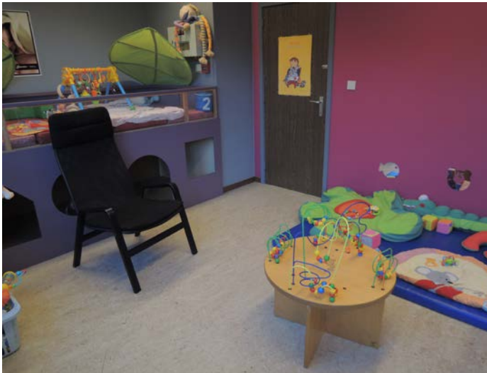
Les espaces sécurisés pour les « tout-petits »