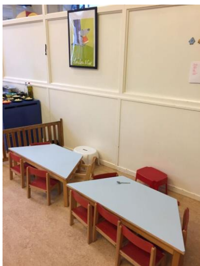
Le coin repas des M2.

Le schéma de la démarche pourrait se traduire comme suit : temps d'observation de l'enfant, partage avec l'équipe, puis essais auprès de l'enfant, avec possibilité de revenir à l'étape précédente.