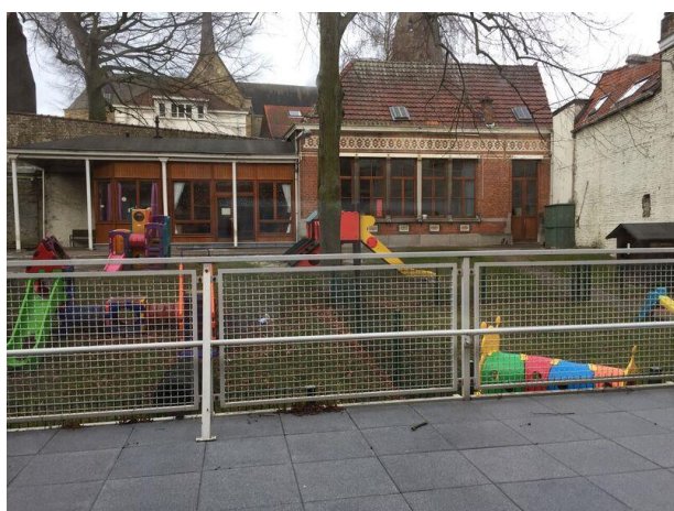
Le jardin de la crèche, vu depuis la terrasse des bébés 2.

Une grande attention est manifestée par les puéricultrices et l'équipe encadrante pour « traduire » aux parents le vécu de leur enfant et les observations faites.