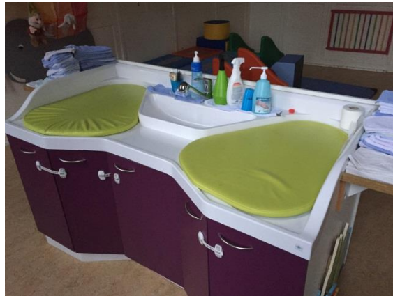
La table de change des M1.

Dans ces moments de change, il est important de veiller à ce qu'une puéricultrice reste présente et disponible auprès du groupe (il n'y a d'ailleurs que deux coussins de change dans les salles).