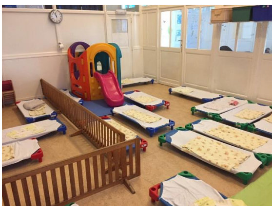
L'espace de sieste des M2.

Lors de ce passage, nous veillons à être attentifs aux enfants qui ont besoin d'une habitude plus douce (besoin de repos en dehors du temps de sieste, besoin d'un lit à barreaux, besoin de garder le tour de lit « contenant »...). Une petite chambre attenante à la section des moyens 1 permet d'offrir un temps de sieste en matinée ou en fin de journée à l'enfant qui en montre le besoin.