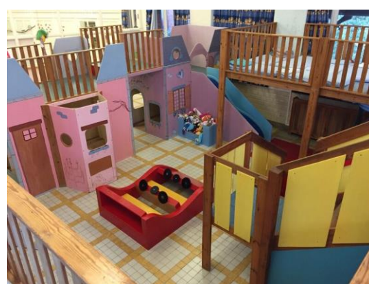
Pièces de vie (et de jeux !) des GD 1 et des GD2