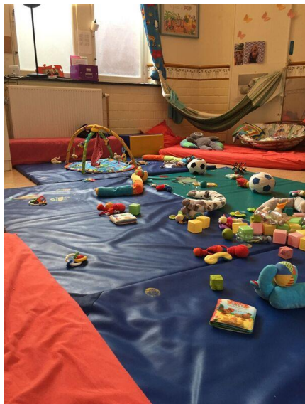
Les espaces de vie des BB1 et des BB2

Les portiques « transformés » peuvent être utilisés en fonction des besoins des enfants (jamais trop longtemps), par exemple durant le temps de digestion de l'enfant, installé dans un relax.