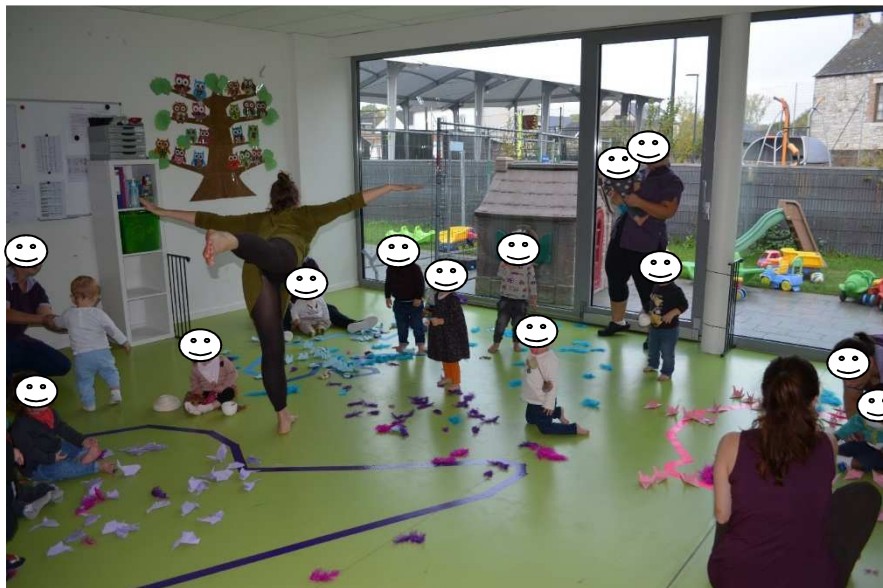
Semences d'Art : Présentation de leur spectacle « Migrations » Octobre 2020

En collaboration avec l'ONE, nous bénéficions d'une représentation théâtrale, spécifique pour les tout petits 1fois tous les 2 ans.